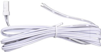
Fil de 2 m pour l'éclairage d'armoire