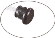
Capteur de porte unique ouvrez la porte lumière allumée, fermer la porte éteindre les lumières