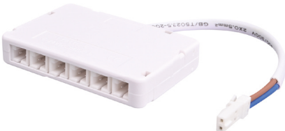
Boîte de jonction à 6 voies