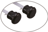
Capteur de porte double ouvrez la porte lumière allumée, fermer la porte éteindre les lumières